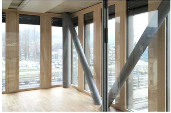
Détail passage de dalle