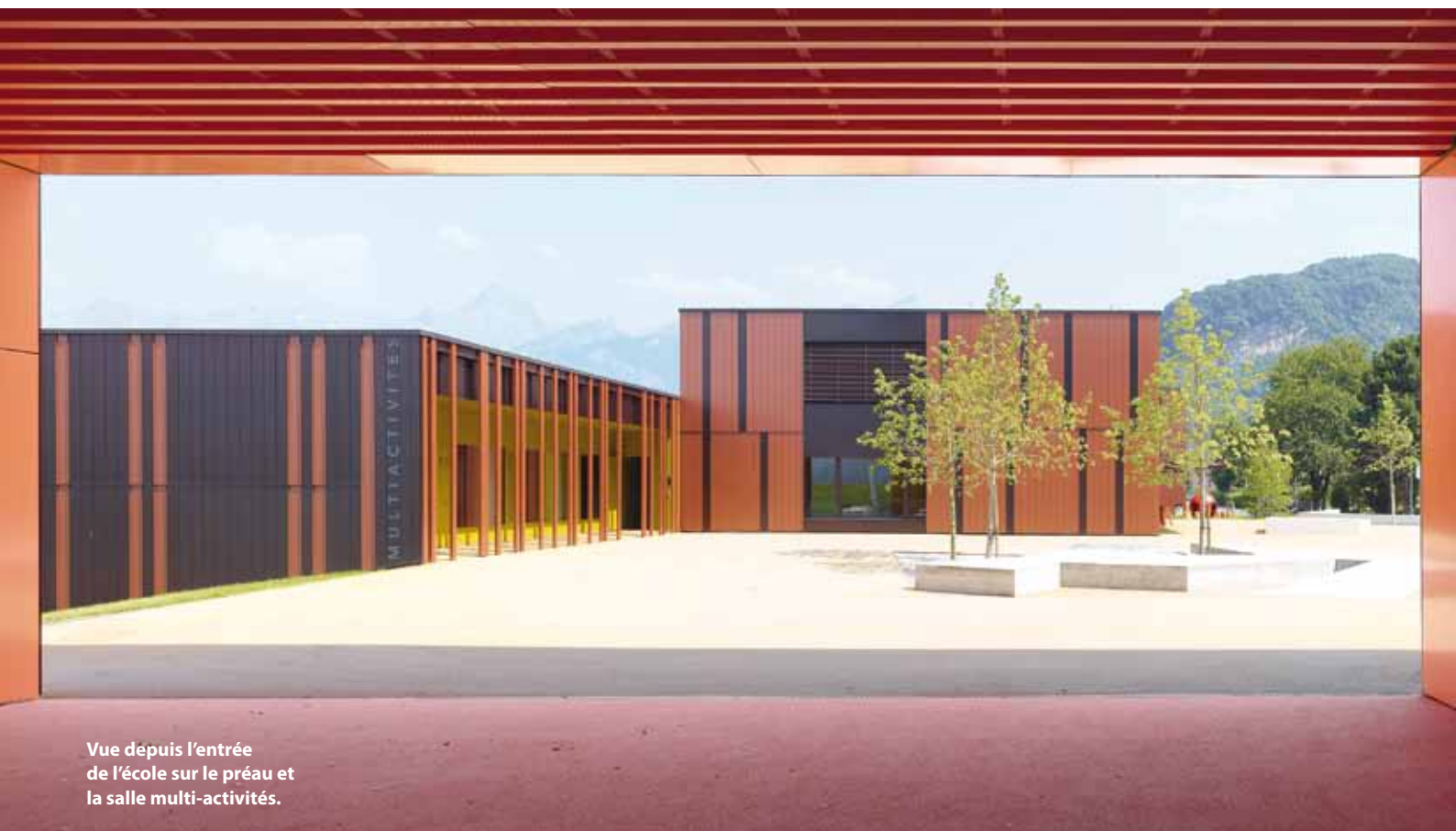
Vue depuis l'entrée de l'école sur le préau et la salle multi-activités.