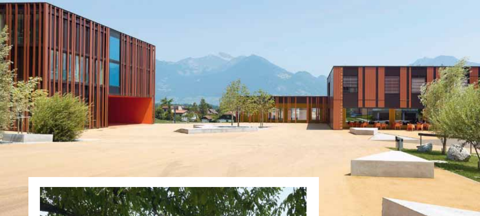
Une cour centrale connecte l'école (à gauche) et l'EMS.