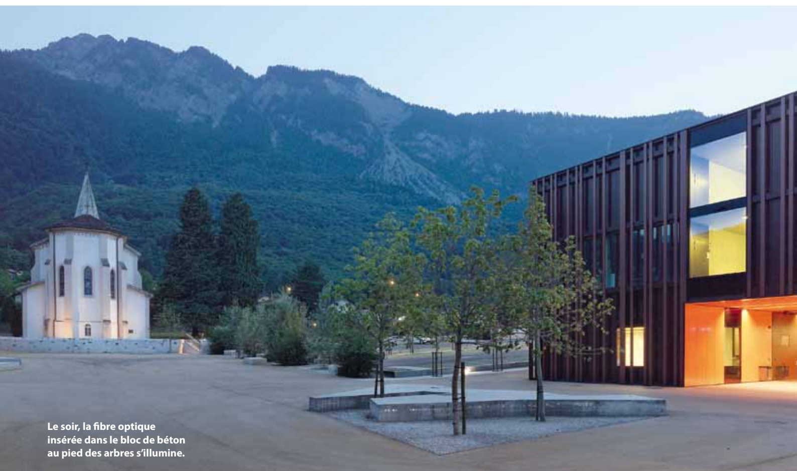
Le soir, la fibre optique insérée dans le bloc de béton au pied des arbres s'illumine.