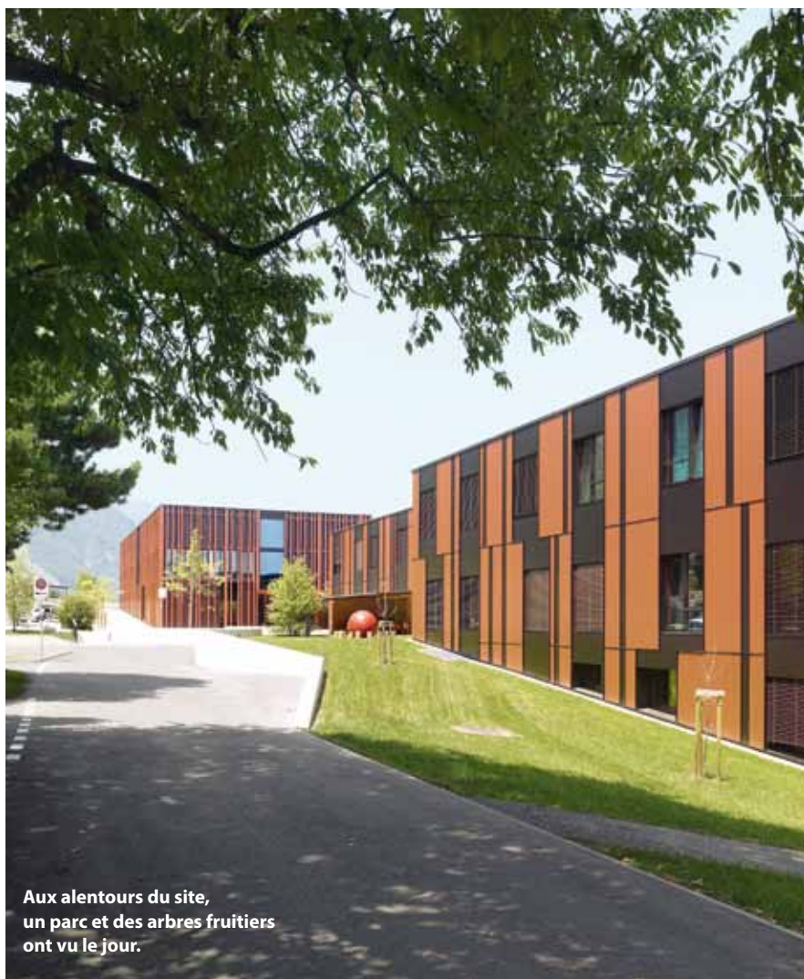
Aux alentours du site, un parc et des arbres fruitiers ont vu le jour.

ment d'un point de vue urbanistique, concilier en son sein une école pour jeunes enfants avec un EMS n'est pas chose aisée.