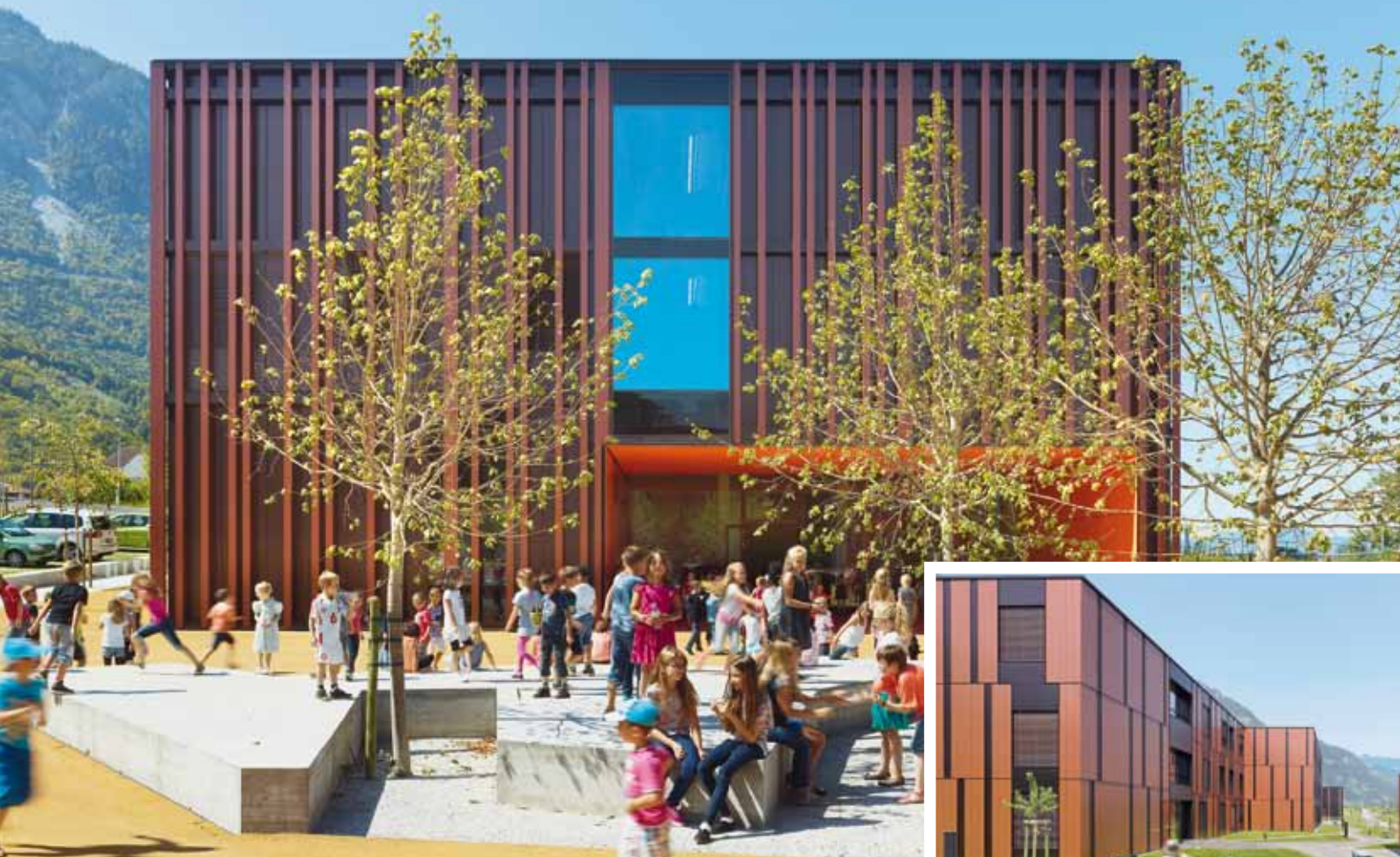
COMPLEXE SCOLAIRE ET EMS, COLLOMBEY-MURAZ (VS)